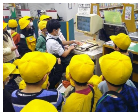
戸塚公民館・図書館見学（２年）