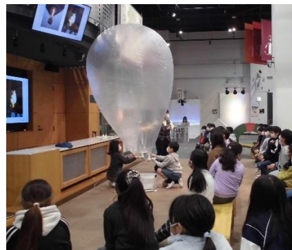
プラネタリウム見学（４年）