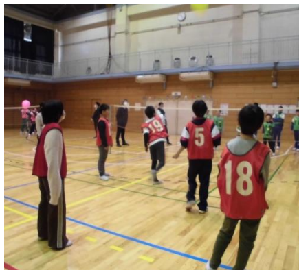
小中交流会（くすのき）