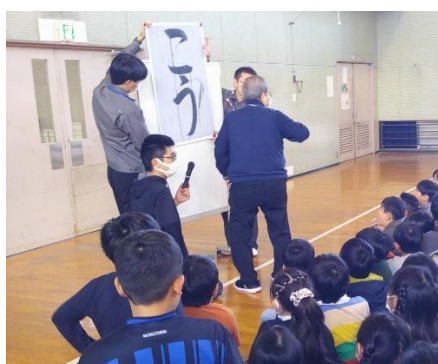
書きぞめ講習会（３年）