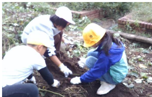
さつまいも掘り（くすのき）